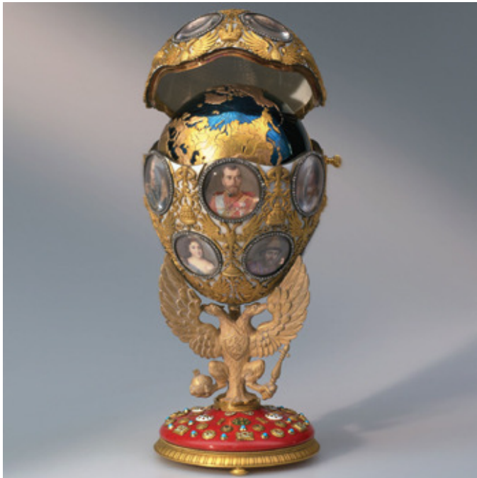
Fabergé Uovo Imperiale Terzo centenario dei Romanov, collezione Museo del Cremlino, 1913

Ma le uova più famose furono indubbiamente quelle di un maestro orafo, Peter Carl Fabergé, che nel 1883 ricevette dallo zar Alessandro la commissione per la creazione di un dono speciale per la zarina Maria. Il primo Fabergé fu un uovo di platino smaltato bianco che si apriva per rivelare un uovo d'oro che a sua volta conteneva un piccolo pulcino d'oro ed una miniatura della corona imperiale. Gli zar ne furono così entusiasti che ordinarono a Fabergé di preparare una serie di uova da donare tutti gli anni. E la tradizione continuò anche con lo zar Nicola II, figlio di Alessandro, fino ad un totale di 57 uova.